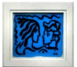
”Freja, din eld”, hinterglasmålning med gudamotiv.

– Jag tycker om den ljusbrytning som blir när man målar på baksidan av glas. Det ger en speciell lyster. Samtidigt är det en väldigt grafisk teknik, som passar mig. Man lägger på färgen i lager. Det gäller att få den att fästa och att inte de olika lagren ska suddas ut varandra.